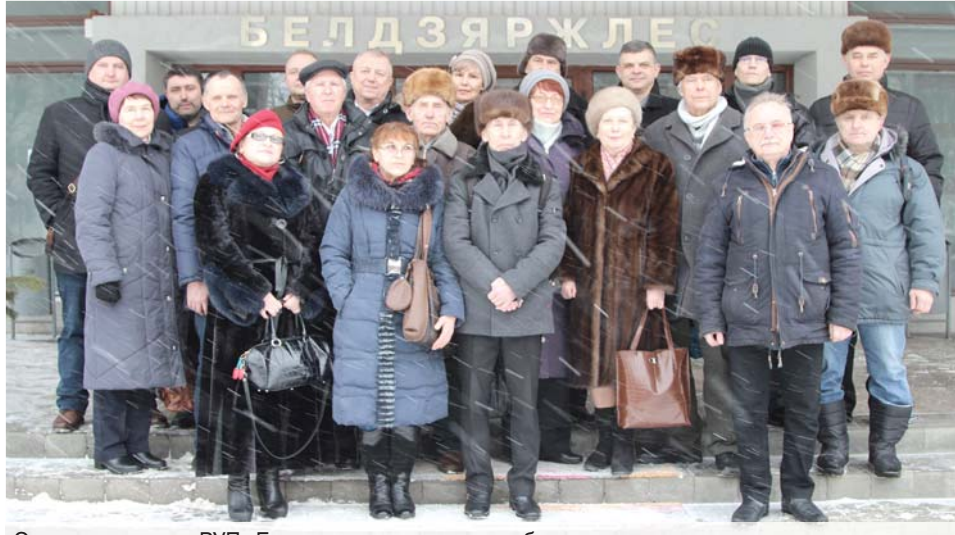
Охотоустроители РУП «Белгослес» разных лет работы.

Нормативной и методической основой проведения данных работ на тот период яв-